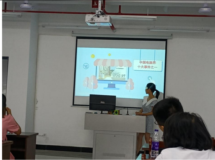
胡影老师分享-动画案例