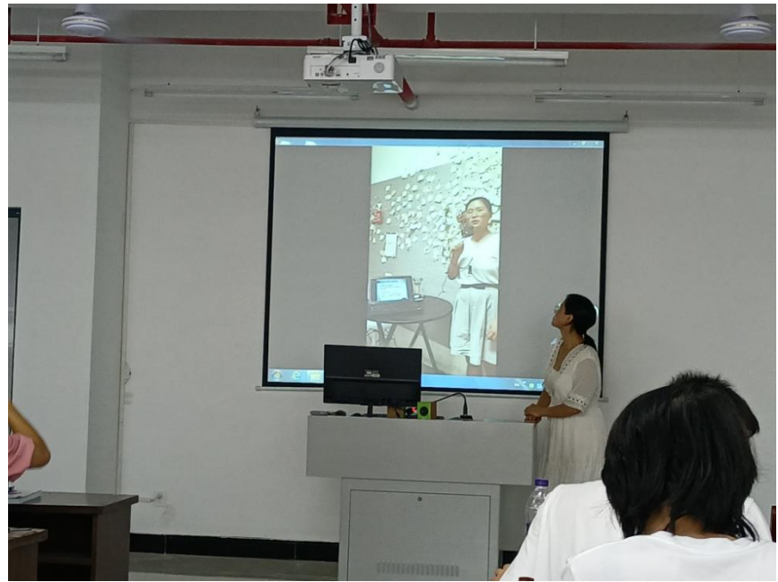
王希老师分享-自制小视频