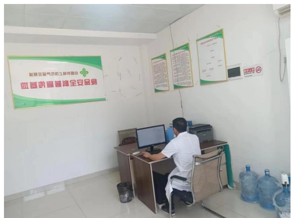
农业类教师在上饶云谷生态农业发展有限公司、上饶市中合农产品市场有限公司开展金线莲的组织培养、农产品信息化管理、食品安全检