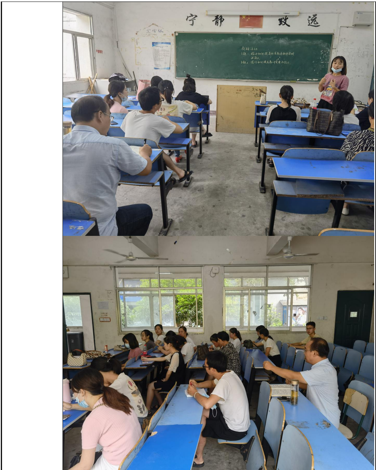
注：此表为电子记录格式，纸质记录格式可参考此表。后面还可附上各活动方案等内容。