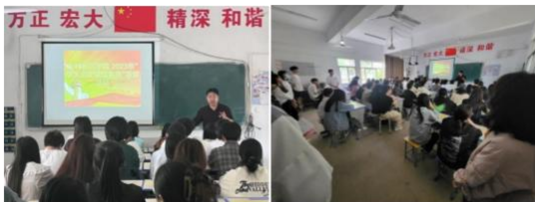
开展资助诚信主题班会

诚信，乃为人之本，人无信则不立。诚信是中华民族传统文化的精髓之一，也是社会大力倡导的道德风尚。为提高大学生诚信意识，乡村振兴学院 10 月 25 日开展资助诚信签名活动。乡村振兴学院的同学们纷纷在签名板上签名，表明自己履行承诺的决心。活动中，学院对班级班干、学生会干部及部分学生代表，开展资助诚信宣讲活动，在广大同学中间营造出了“人人知诚，人人讲诚信”的良好教育氛围。